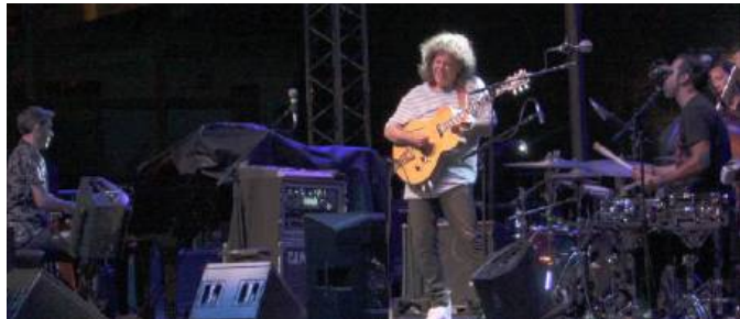
Il chitarrista Pat Metheny durante il concerto di giovedì 28 al Teatro romano

AOSTA (mye) Torna la musica sotto al Teatro romano di Aosta, grazie ad Aosta Classica, inaugurata lunedì 23 luglio dal violinista prodigio Giuseppe Gibboni assieme all'Orchestra dei Pomeriggi musicali di Milano. Giovedì scorso, 26 luglio, invece, è stata la volta di una delle stelle della rassegna, ovvero il grande chitarrista jazz Pat Metheny. Il calendario di Aosta Classica - tutte le serate iniziano alle 21.15 - prosegue lunedì 30 alla Torre dei Balivi, con il Quatuor du Conservatoire di Aosta; martedì 31 alla Cittadella dei giovani con "ICUBA! El Conjunto Sfom", altro progetto valdostano, composto da Serena Charey, Marco Brunet, Christian Curcio, Gabriele Peretti, Laura Parrello e Lucal Del Col, e l'ospite speciale Janier Isusi. Si torna poi al Teatro romano, dove mercoledì 1 agosto il violinista Fabrizio Pavone con-