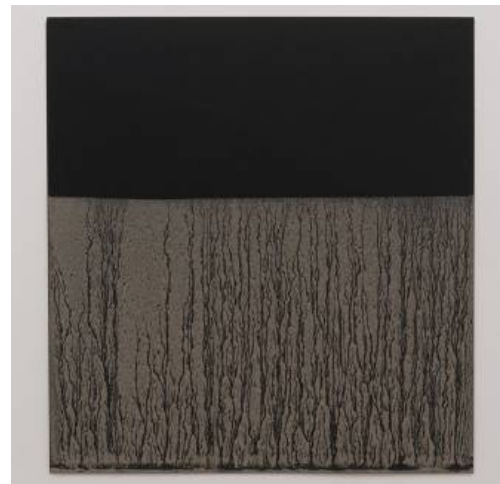
Due opere di Richard Long: a sinistra "River Avon" e, sopra, "Untitled 2000". L'esposizione "Il canto della Terra" nelle baite di Pra Sec in Val Ferret a Courmayeur sarà visitabile da domani, domenica 29 luglio, fino a domenica 26 agosto

Per quello che è senza dubbio l'appuntamento più atteso dell'estate culturale di Courmayeur, gli orari di apertura delle baite di Pra Sec sono tutti i giorni, dalle 11.30 alle 16.30, a partire appunto da domenica 29 luglio e sino a domenica 26 agosto.