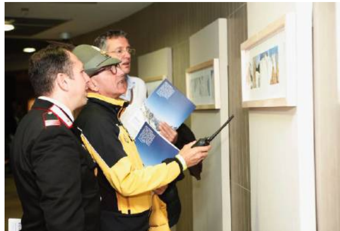
La mostra "Il risveglio del sublime" è stata inaugurata sabato scorso, 21 luglio, alla presenza di un numeroso pubblico