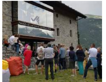
L'inaugurazione di sabato 21 luglio

GIGNOD (zgn) E' stata inaugurata sabato scorso, sabato 21 luglio, nella Maison de l'Artisanat International, a Caravex di Gignod, la nuova mostra biennale "Bâton Amis" curata e gestita dall'Institut Valdôtain de l'Artisanat de Tradition. L'allestimento propone circa 400 bastoni, da quelli di comando africani a quelli religiosi, con le preziose pastorali di proprietà della Diocesi di Aosta, a quelli popolari valdostani, con la collezione Brocherel e le collezioni di privati per finire con le rappresentazioni del bastone in opere pittoriche della collezione Plassier di La Salle. La mostra è arricchita dalla rassegna musicale "Bastoni Sonori" curata da Selene Framarin che propone, tutti i sabati d'estate, dalle 17.30, concerti in cui il bastone si anima attraverso le note.