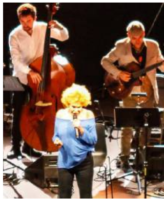
Ornella Vanoni durante il concerto al Forte di Bard di giovedì 26 luglio

SARRE (mye) Grande successo, la sera di giovedì scorso, 26 luglio, per il concerto di Ornella Vanoni nel Forte di Bard. Gli spettatori erano più di 400, tra turisti e fans. La celebre cantante si è esibita nello spettacolo "La mia storia", un racconto in musica della straordinaria carriera artistica di una delle voci più apprezzate nel panorama canoro del nostro Paese.